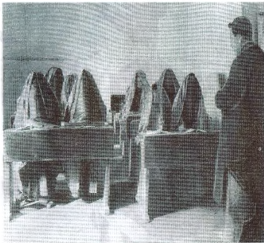
Хотин-қизлар саводсизлигини тутатиш мактаби. 20-йиллар.