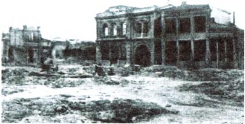
Туркистон Мухторияти қизил аскарлар томонидан тор-мор қилингандан сўнг Қўқон шаҳрининг кўриниши. 1918 йил февраль.