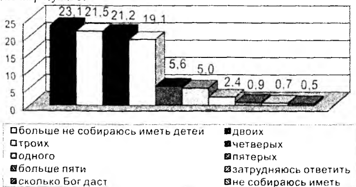
Рис. 3. Распределение ответов на вопрос: «Сколько всего Вы лично собираетесь иметь детей?», %

Мнение респондентов о том, сколько они собираются иметь детей, представлено на рисунке 3.