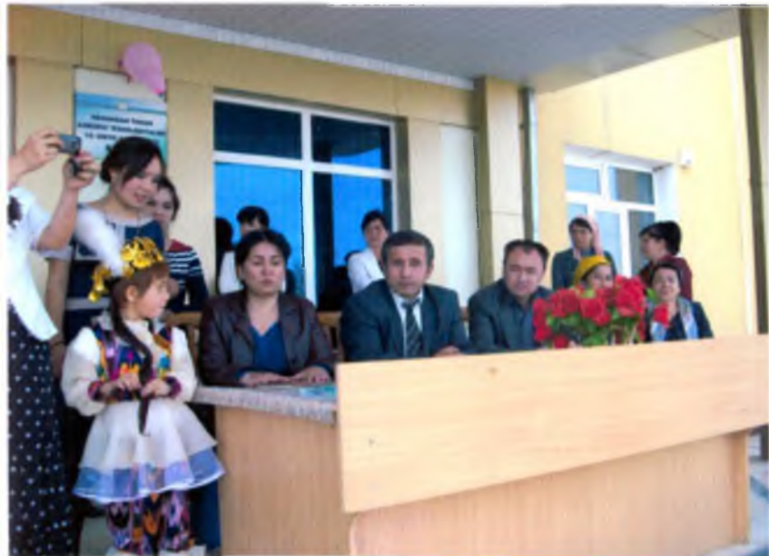
Milliy g'oya, ma'naviyat va huquq asoslari kafedrası o'qituvchilarining Namangan tumani Qumqo'rg'on kasb-hunar kollejidagi tadbirda ishtiroki