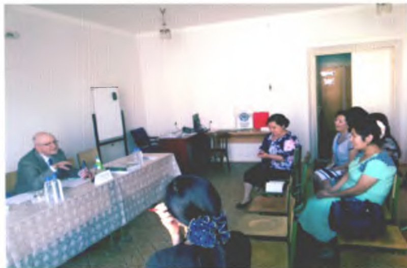
Professor Shrayberning ingliz tili yo'nalishi talabalari bilan Germaniyada tarjimashunoslik masalalari bo'yicha suhbatı