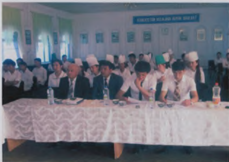
Nam DU professor-o'qituvchilari tomonidan Namangan tibbiyot kollejida o'tkazilgan tadbirdan lavha