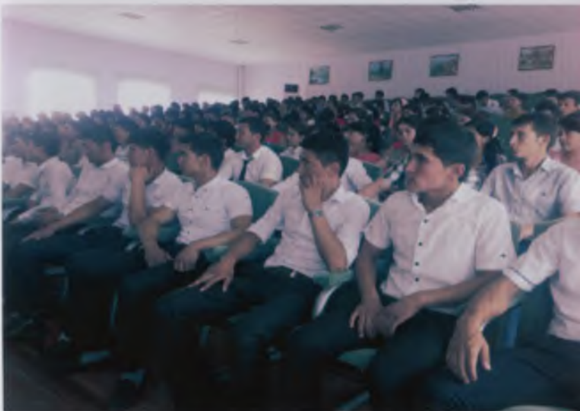
Nam DU Ijtimoiy-iqtisodiy fakulteti talabalarining ilmiy konferentsiyasidan lav