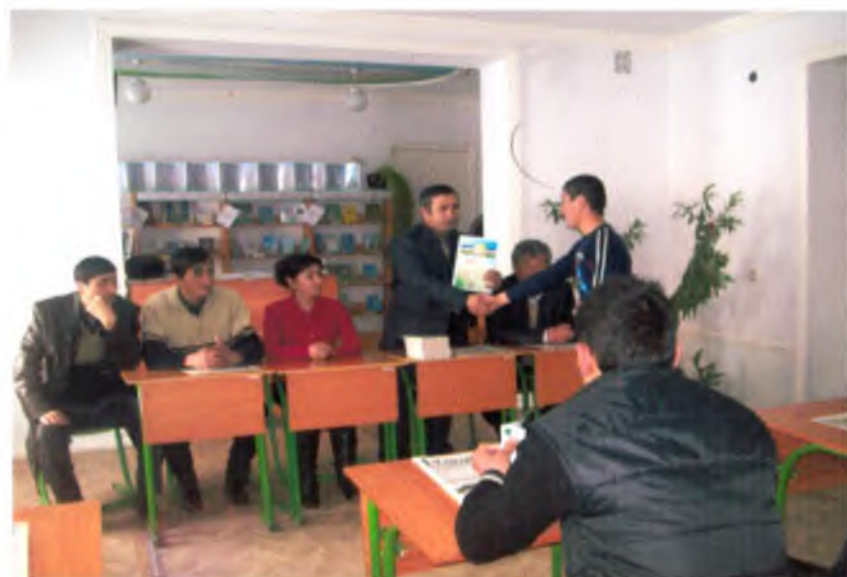
Milliy g'oya, ma'naviyat va huquq asoslari kafedrası o'qituvchilarining Uchqo'rg'on tumani Yangiver kasb-hunar kolleiidagi tadbirda ishtiroki