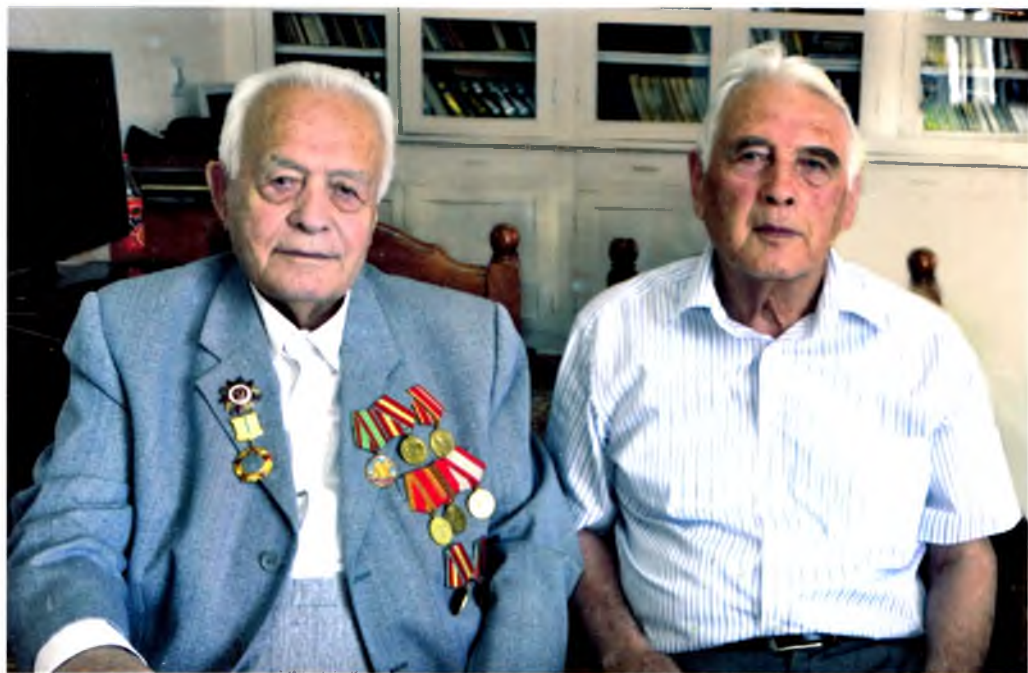
Қариндоши профессор Сайфи Азимов, 2013 йил