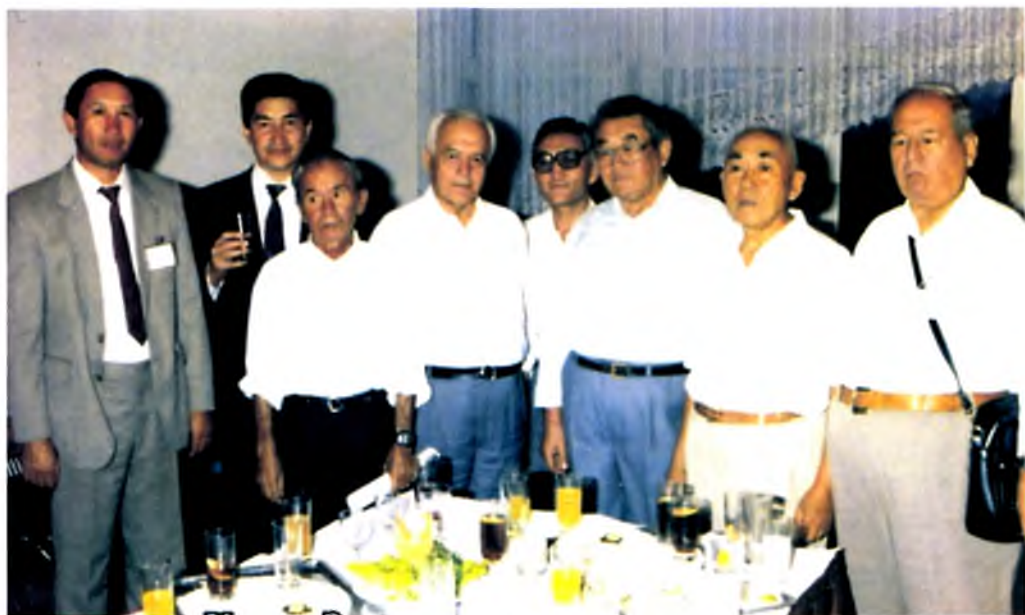
Туркия пойтахти Анкарада ўтказилган халқаро анжуман