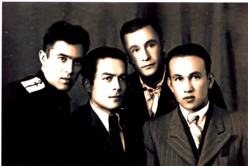
Темир йўллар соҳаси бўйича аспирантлар даврасида, Санкт-Петербург, 1949 йил