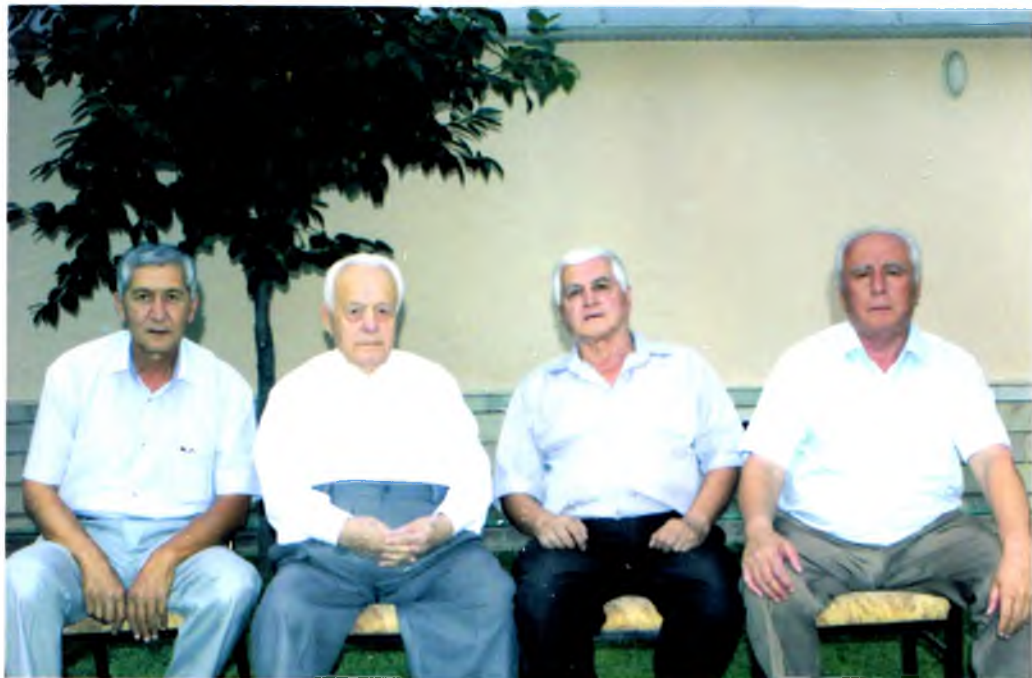
Кариндошлар даврасида, 2013 йил