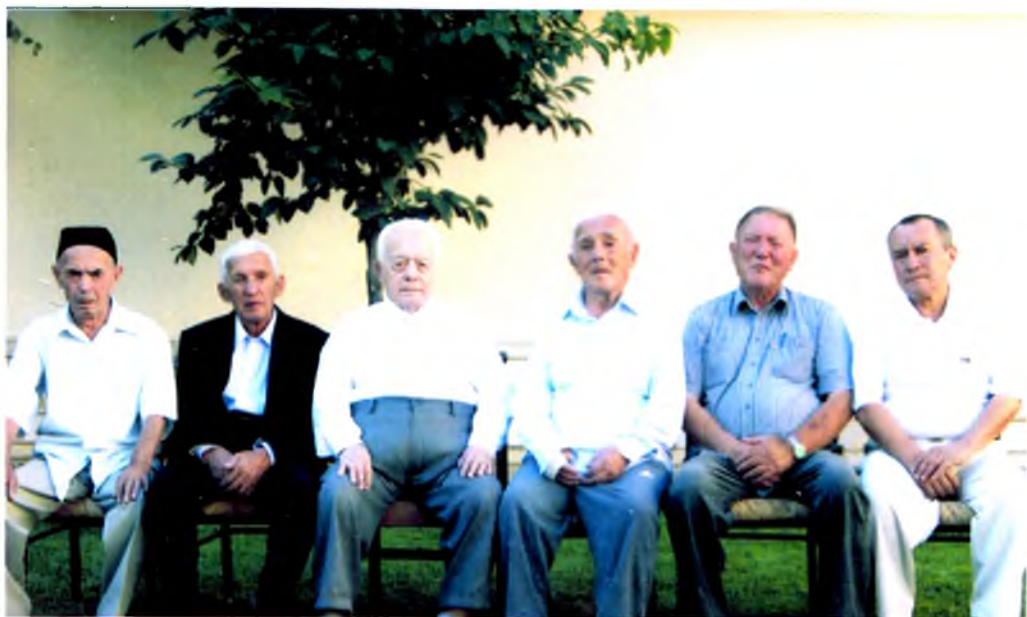
Қўшнилар даврасида, 2013 йил