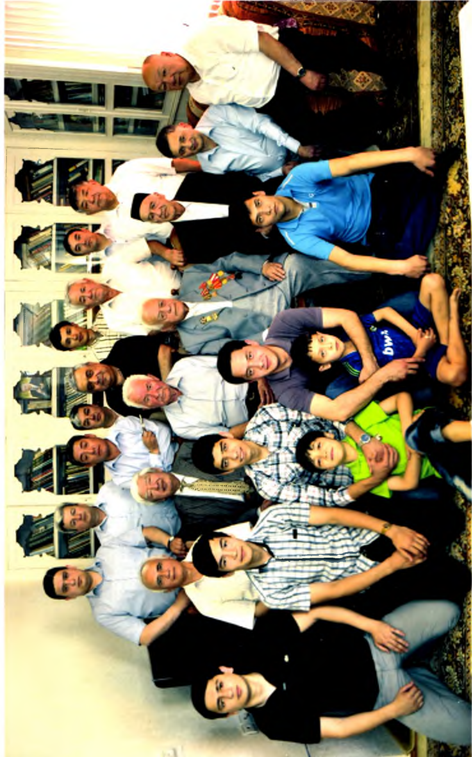
Қариндошлар ва шогирдлар даврасида, 2013 йил