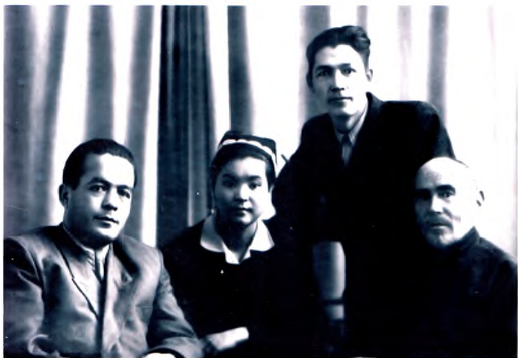
Сибирлик ўзбеклар авлодларининг даврасида, Тюмен, 1957 йил