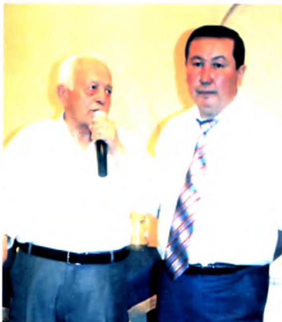
Профессор Асқар Бегадил ули Абдуали, Қозоғистон, 2006 йил