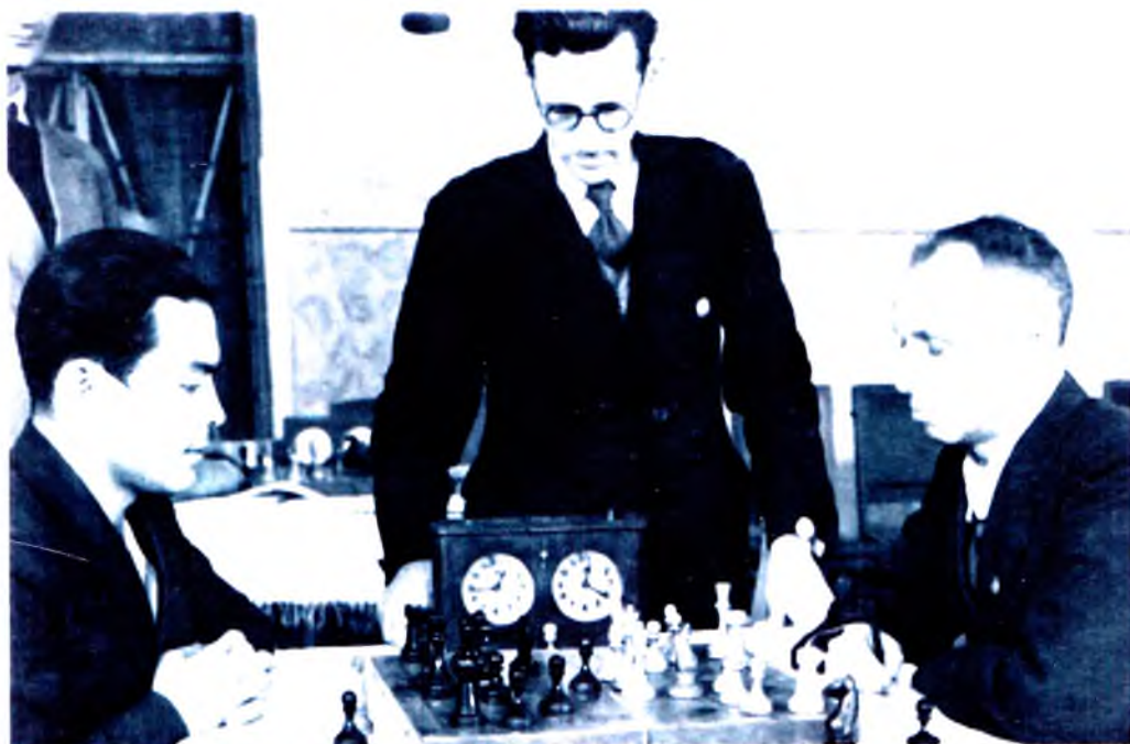
Шахар шахмат мусобакасида, 1947 йил