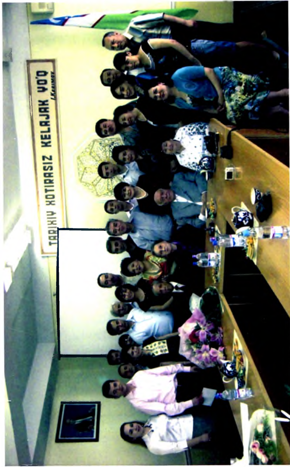
Ўзбекистон фанлар академияси Тарих институти олимлари давраида, 2013 йил