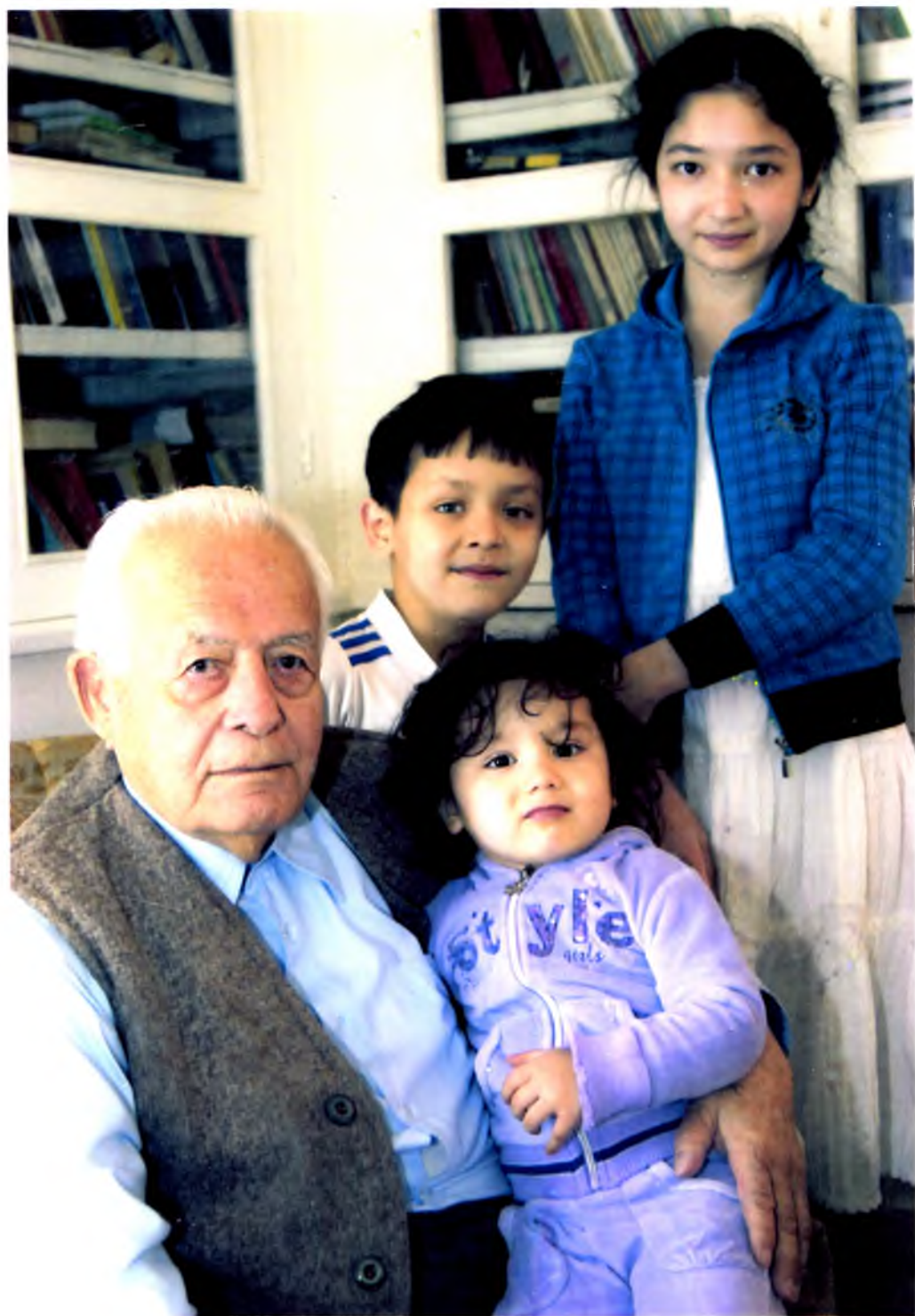
Невара ва эваралар, 2013 йил