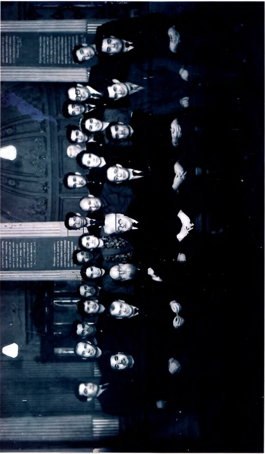
Россия фанлар академияси Шарқшунослик институтининг олимлари, Ўзбек аспирант ва докторантлари даврасида, Санкт-Петербург, 1950 йил