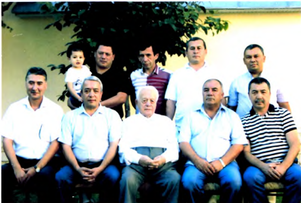
Қўшнилар даврасида, 2013 йил