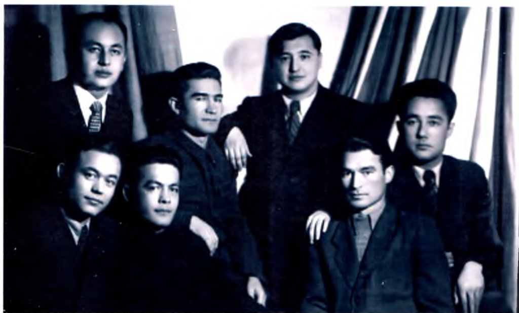
Ўзбекистонлик аспирантлар даврасида, Москва, 1952 йил