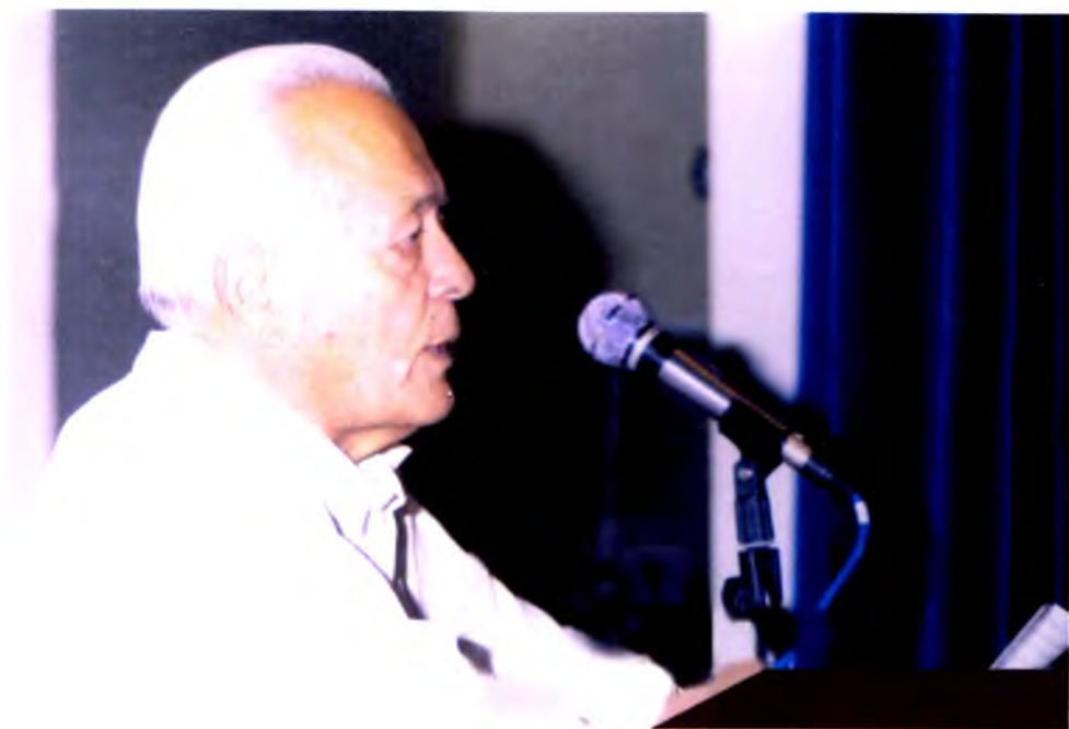
Туркия пойтахти Анқарада ўтказилган халқаро анжуман