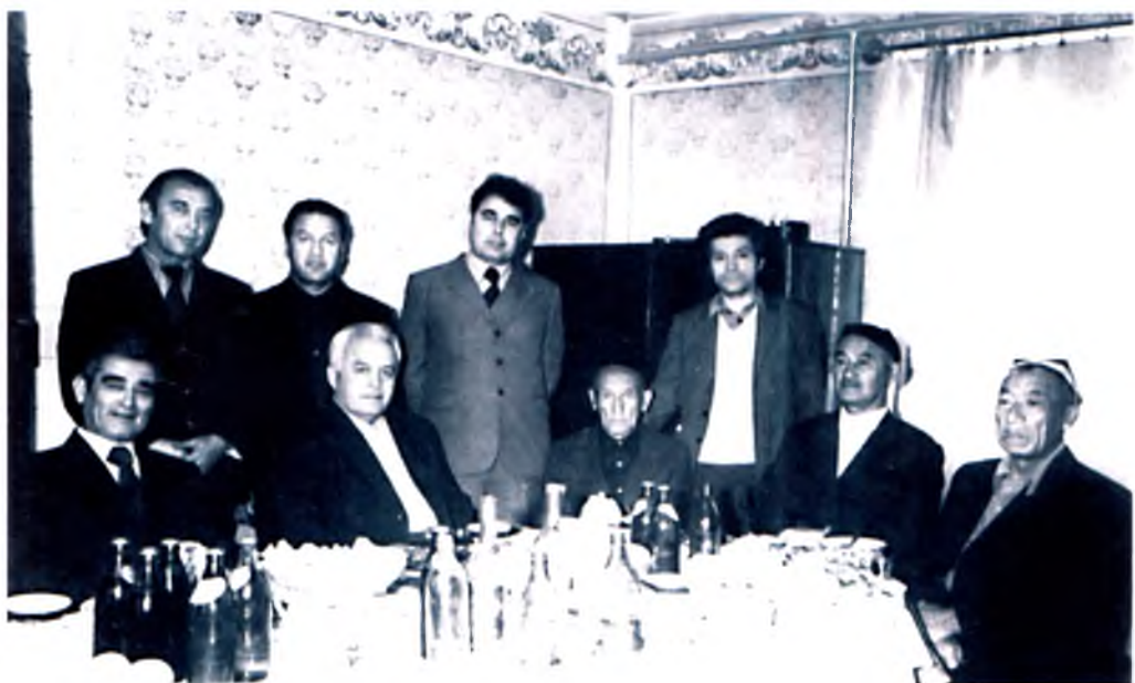
Қариндошлар даврасида, 1983 йил