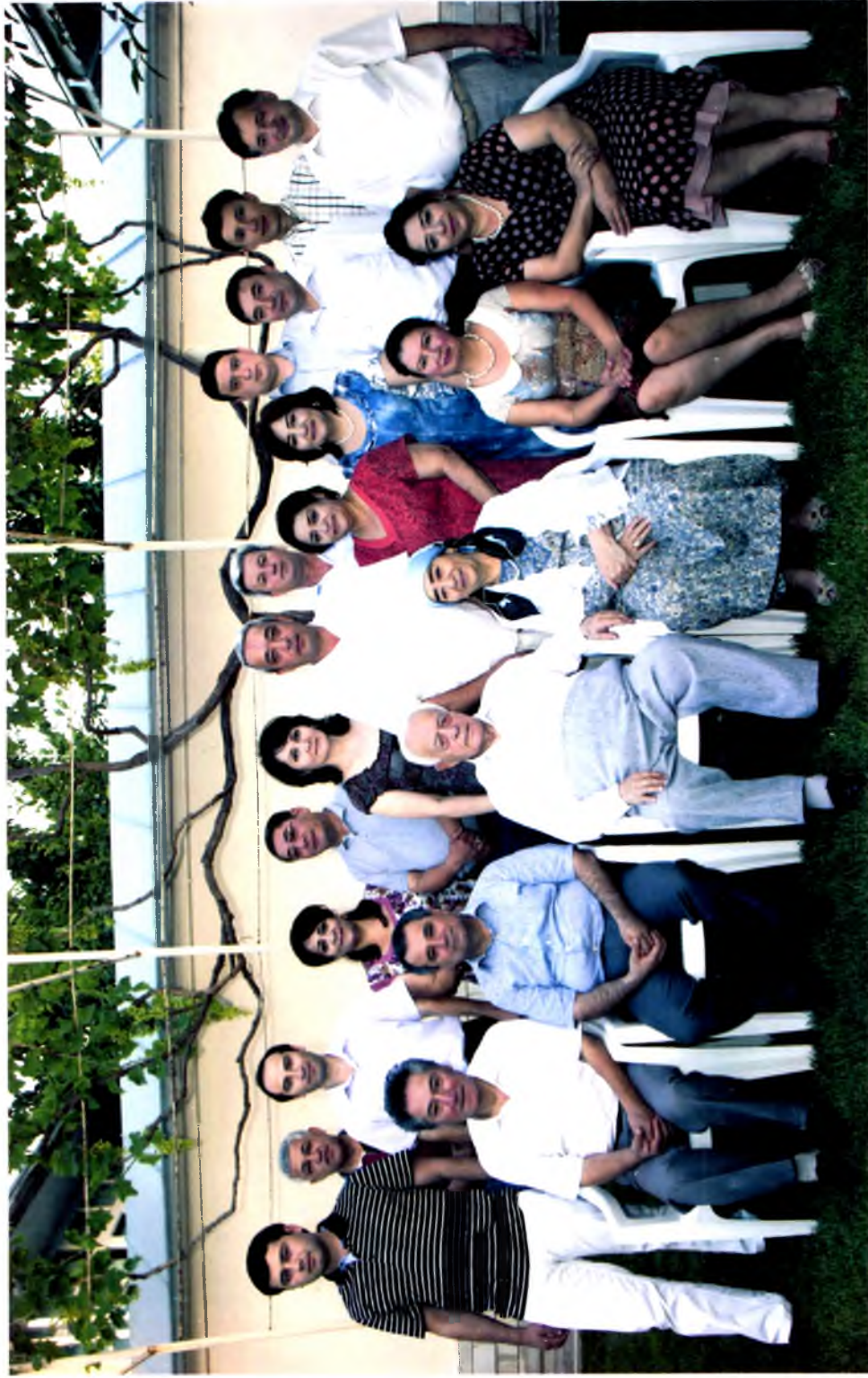
Оиласи ва қариндошлар даврасида, 2013 йил