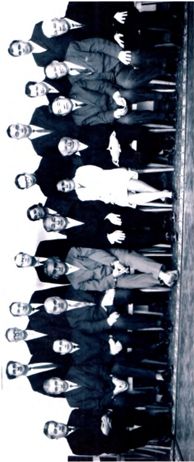
Республикалар олимлари давраида, 1965 йил