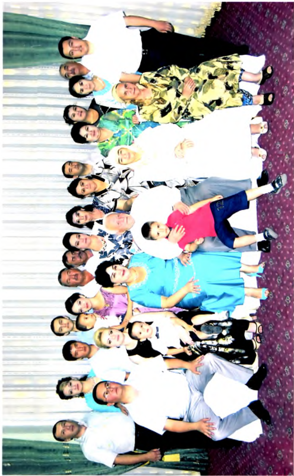
Қариндошлар даврасида, 2013 йил