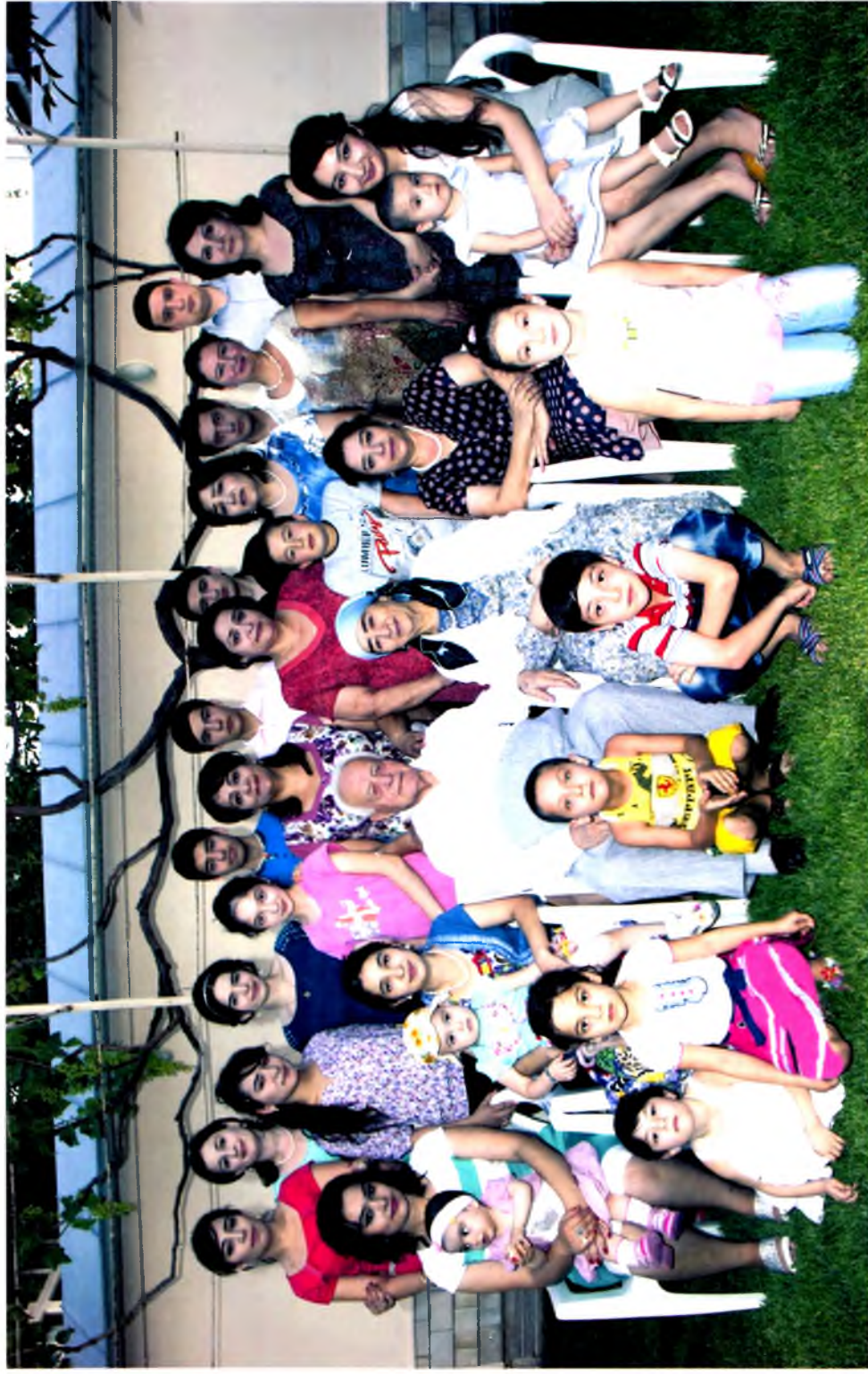
Оила, набира ва эваралар даврасида, 2013 йил