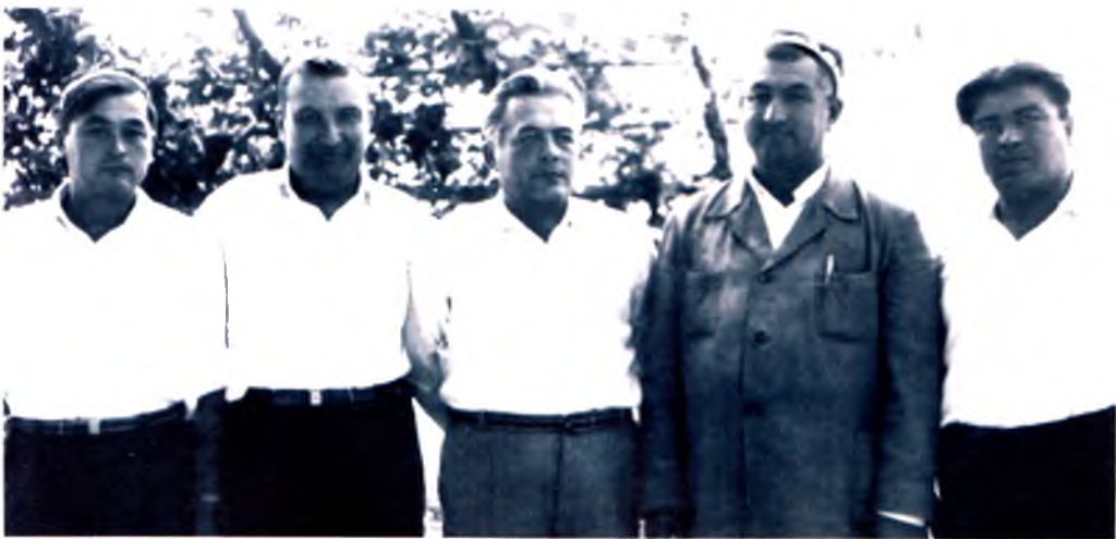
Наманглик шогирд ва дўстлар даврасида