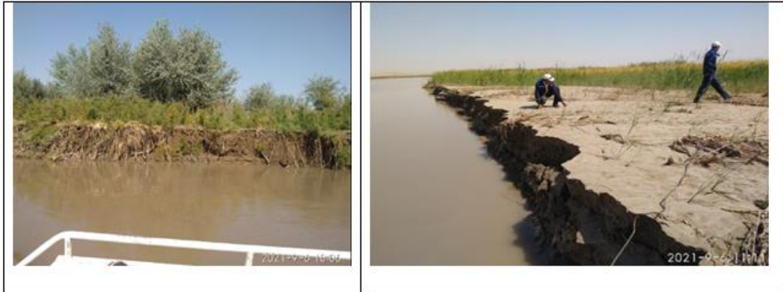
Рис 1. Наблюдения ниже бесплотинного водозабора КМК для определения интенсивности русловых процессов.

воды скорость смещения составляла 1 м / сут, а при высоком уровне воды 10-15 м / сут. Зимой, когда уровень был высоким, эта величина составляла 4 м / сут, что составляет от 0,5-1,5 км до 10 км вдоль побережья. По направлению потока левый берег сместился вправо на 110 метров в период с 7 июля по 10 сентября 2021 года. В 2019-2021 годах 15-30 метров берега Амударьи было размыто за 30-40 минут.