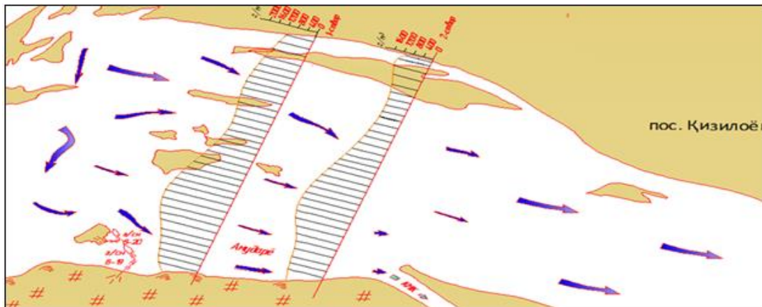
Рис-5 Распространение мутности на бесплотинном водозаборе КМК.

Мутность потока достигла максимальных значений в весенний и летний периоды. Максимальная прозрачность воды наблюдалась осенью и зимой (рис. 5). Изменение направления потока увеличивает меандрирование русла реки в районе исследования.