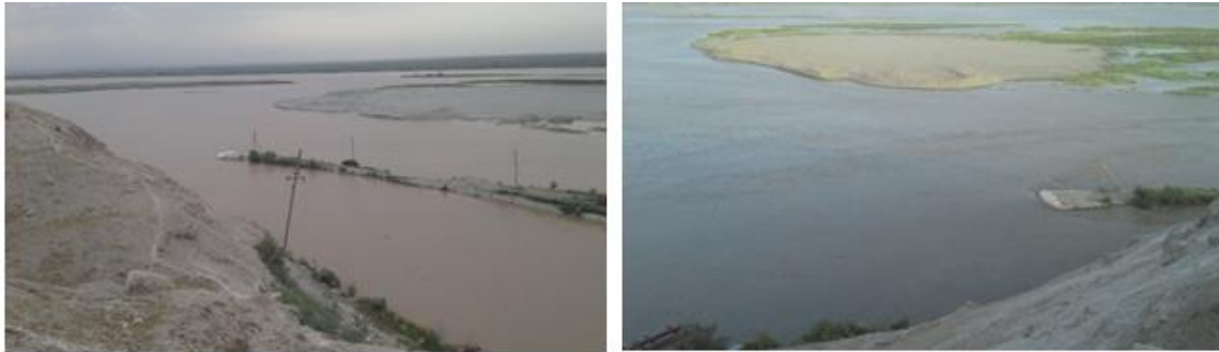
Рис.2 Бесплотинный водозабор КМК.

примера можно привести следующее: в результате аккумуляции наносов на дне, горизонт воды может подняться выше поймы, что создаст угрозу затопления расположенных на них культурных земель и населенных пунктов. Интенсивный размыв берегов, характерный для рек Средней Азии, тоже приводит к нежелательным последствиям, таким как смыв близкорасположенных культурных земель и населенных пунктов, возникновение угрозы обеспечения нормального водозабора оросительных каналов при бесплотинных водозаборах [6,7,11] (Рис-1).