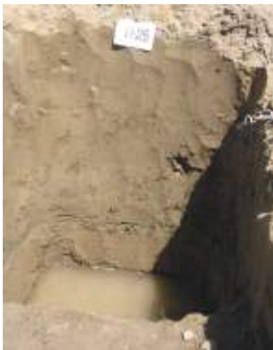
2-расм. Тақир-ўтлоқи тупроқлар профилнинг умумий кўриниши

аста камайиб бориши, тўқ ранг-ни сақлаб туриши кабилар шулар жумласидандир.