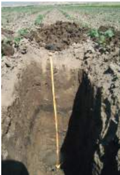
1-расм. Эскидан суғориладиган ботқоқ-ўтлоқи тупроқлар профилининг умумий кўриниши

Суғориладиган ўтлоқи ва ботқоқ-ўтлоқи тупроқлар